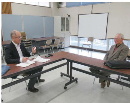
ヒアリングの様子